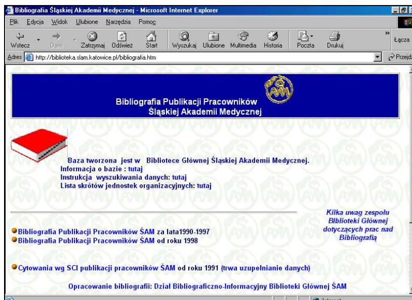
Rys. 1 Strona główna Bibliografii Publikacji Pracowników Śląskiej Akademii Medycznej

Istnieje możliwość wyboru lat, z których mają pochodzić prace cytujące. Dokonujemy tego poprzez zaznaczenie odpowiednich prostokątów znajdujących się pod formularzem. W przypadku braku wyboru lat, system prezentuje dane za wszystkie lata. Otrzymany spis publikacji zawiera pełne opisy publikacji pracowników ŚAM, a pod nimi – prace podające je w swojej literaturze załącznikowej (rys.2).